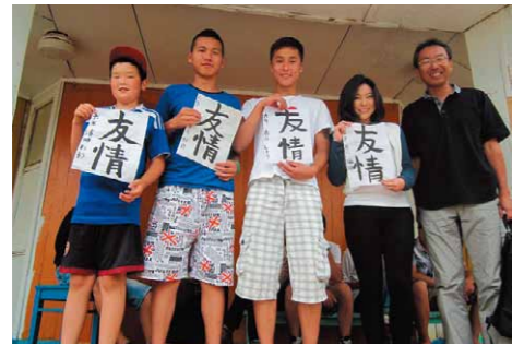
日本の小学生が書いた習字の作品を手渡す

歯ブラシが写っているのを見て、手を洗っていると気がつく児童がいた。水を大切にしていることに気づいた児童がいた。