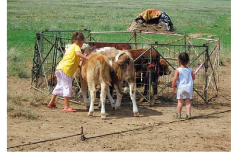
家畜を柵の中に入れる子どもたち