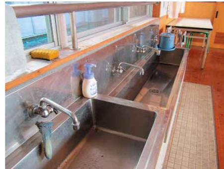
七里小学校内 水道

家庭生活の様々な場面で水を使っていることを踏まえ、わたしたちはその水をどうやって手に入れているかを考えてみた。そして、わたしたちがどれだけふんだんに水を使っているかということを考えさせるために、学校にはどれくらい水道の蛇口があるかを調べた。